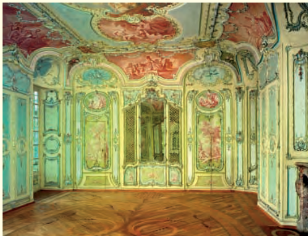
Kabinettsbibliothek der Kurfürstin

Die badische Großherzogin Stéphanie, Adoptivtochter des französischen Kaisers Napoléon, modernisierte das Schloss im Inneren zum Teil im klassizistischen Empire-Stil. Bis zu ihrem Tode 1860 blieb Mannheim Witwensitz dieser einflussreichen Fürstin mit ihren Beziehungen zu vielen europäischen Herrscherhäusern.